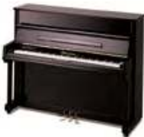
Pearl River UP118M

Пианино вертикальное, 118 см, черное полированное