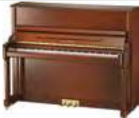
Kayserburg UH123 /D126

Пианино вертикальное, 123 см, махогани, полированное, с банкеткой, вес 249 кг