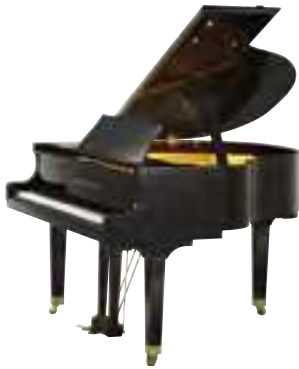
Kayserburg GH160 /A111

Рояль, 160 см, черный, полированный, с банкеткой, вес 295 кг