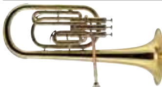
J. Michael AH-500

Альт Eb, 3-х помповый, желтый лак, кейс в комплекте