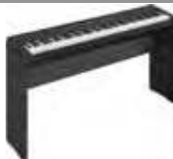
Yamaha P-105 B

Цифровое пианино со встроенной акустикой, 88 взвешенных клавиш, компактный корпус с