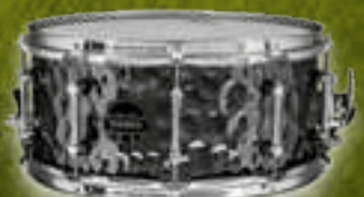
THE DAISY CUTTER ARST465HCEB