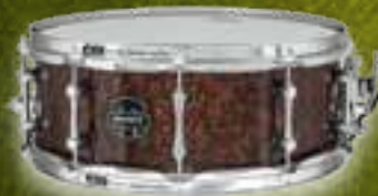
THE DILLINGER ARLM4550KCTK