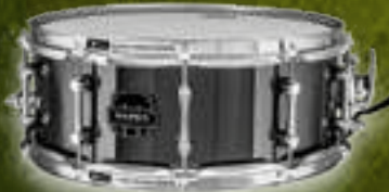
THE ТОМАНАВК ARST4551CEB