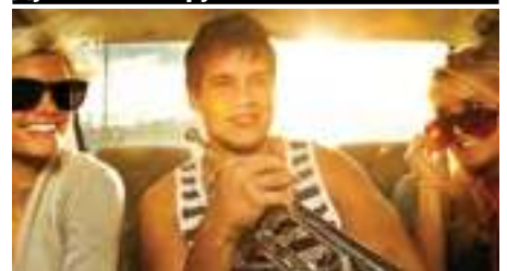
Bach Artisan 180S37G

Труба Bb Stradivarius, профессиональная, раструб: томпак, серебряное покрытие, мензура: .459", раструб ручной ковки, мундштук Bach 7C в комплекте, кейс в комплекте