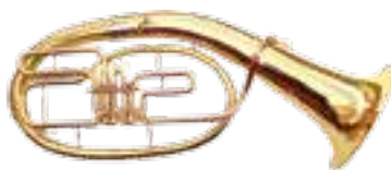
J. Michael BT-800

Тенор Bb, 3-х вентильный, желтый лак, кейс в комплекте