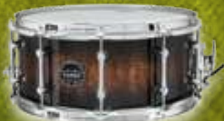
THE EXTERMINATOR ARBW4650RCTK