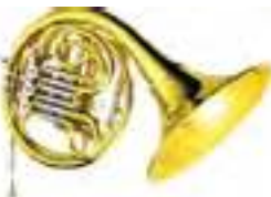
J. Michael FH-850

Валторна двойная F/Bb, корпус из желтой меди, 4 вентиля, съемный раструб, полужесткий кейс в комплекте