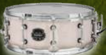
THE PEASEMAKER ARMW4550KCAI

Музыкальный Арсенал – эксклюзивный представитель Марех в России